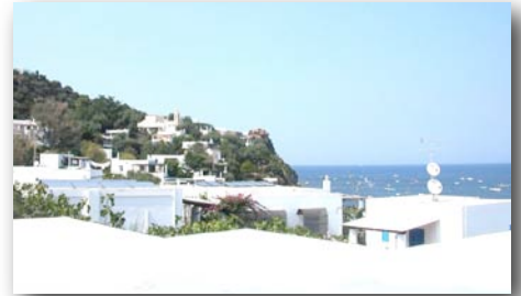
STROMBOLI , ISOLE EOLIE