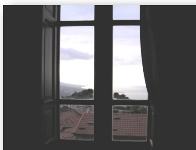
PANORAMA DALLA CASA LIBERTY