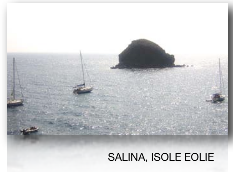
SALINA, ISOLE EOLIE