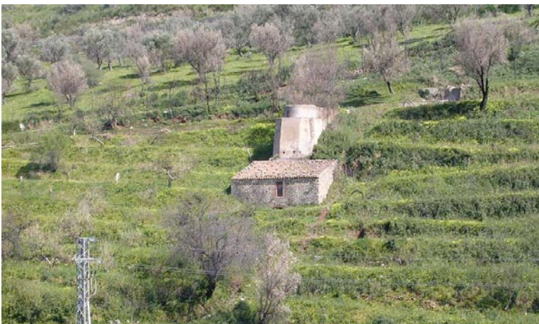
MULINO AD ACQUA

ISOLE EOLIE MILAZZO PARCO DEI NEBRODI CAPO D'ORLANDO SAN GREGORIO TINDARI TAORMINA GOLE DELL'ALCANTARA PALERMO