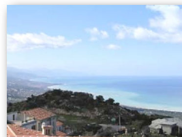
PANORAMA DALLA CASA LIBERTY