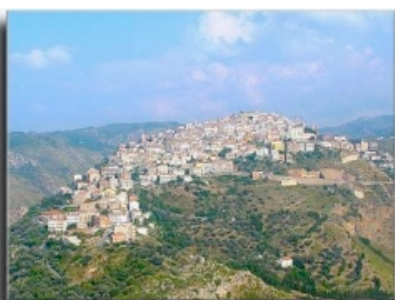
VISTA AEREA DI SAN MARCO

CASE VACANZA/HOLIDAY HOUSES SERRO MULINO